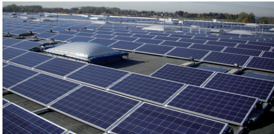
Солнечная установка в Дерхинге (Германия).