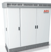
PV.560/690/880 Metal Housing/ Outdoor