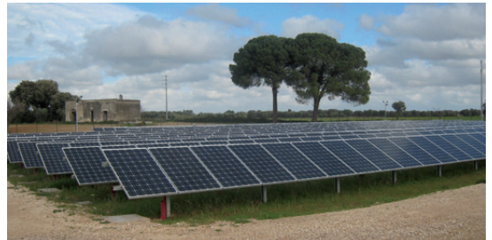
Солнечный парк в Лечче (Италия) мощностью 5,75 МВт.